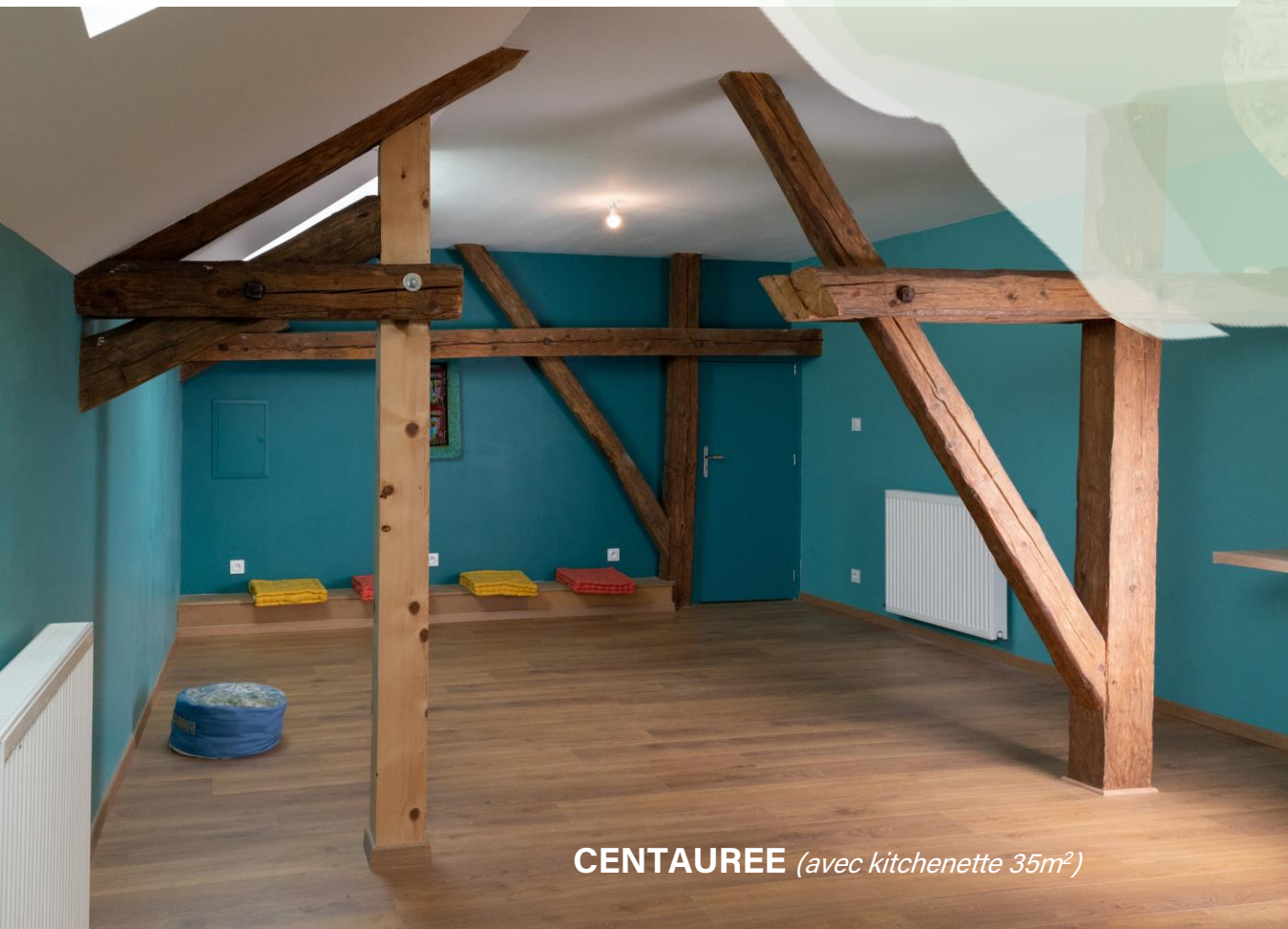
CENTAUREE (avec kitchenette 35m 2 )