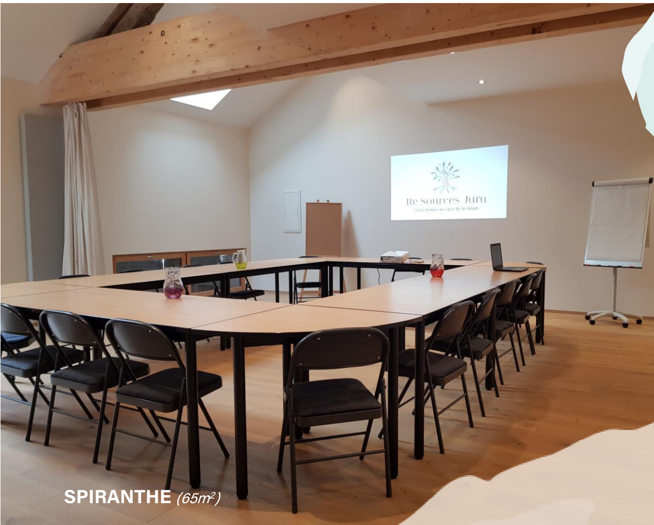
SPIRANTHE (65m 2 )