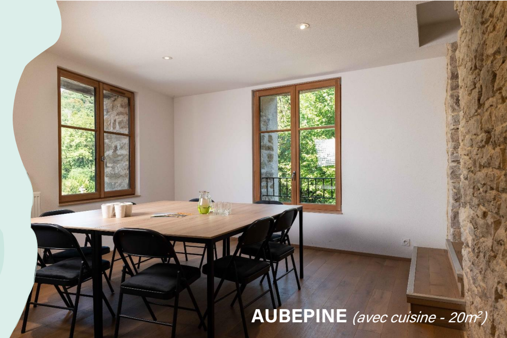
AUBEPINE (avec cuisine - 20m 2 )