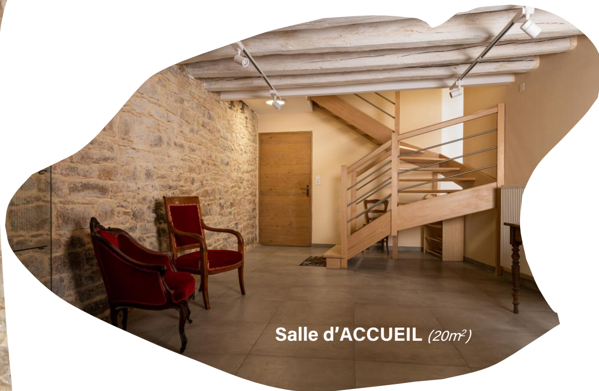
Salle d'ACCUEIL (20m 2 )