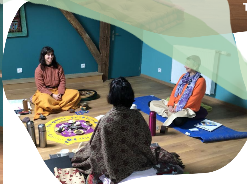
TETRIX (20m 2 )